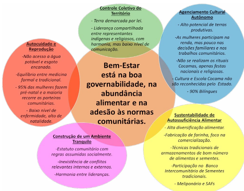
Imagem 1: Sistematização das Capacidades e Bem-Estar de Nova Aliança